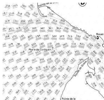
3h ap PM