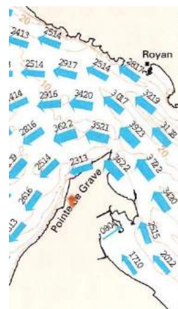
2h ap PM